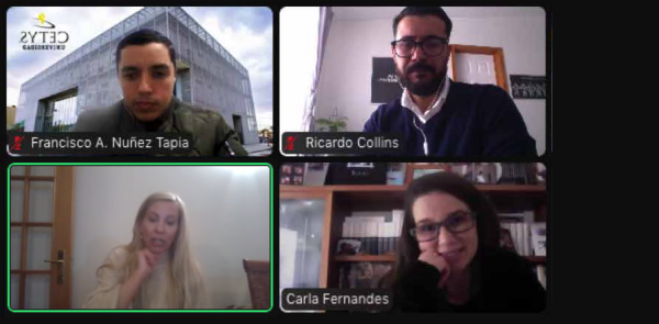
TWINE Conference - Co-creating sustainable rural tourism experiences with food & wine, local culture, landscapes, and people February, 24 and 25, 2022

investigación, e impulsar con ello el posicionamiento de CETYS a nivel internacional, además de compartir con el mundo, y mediante diversos casos de estudio, la relevancia creciente del binomio gastronomía-enología en el Valle de Guadalupe y su inserción como símbolos culturales de la identidad bajacaliforniana.